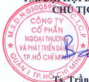
Ts. Trần Bảo Toàn